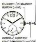
головка (исходное положение)