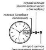
первый щелчок (выставление числа и дня недели)