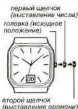
головка (исходное положение)