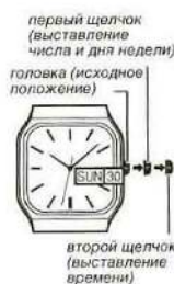
первый щелчок (выставление числа и дня недели)